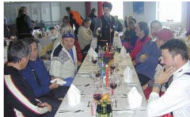
Erfahrungsaustausch der Neustifter Touristiker