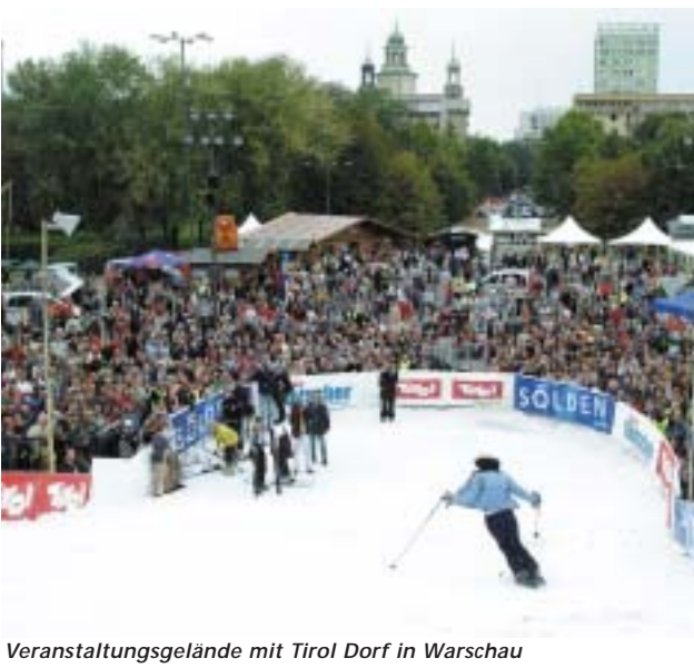
Veranstaltungsgelände mit Tirol Dorf in Warschau

hütten und Skipiste aufgebaut. An beiden Veranstaltungstagen wurden rund 60.000 Besucher gezählt.