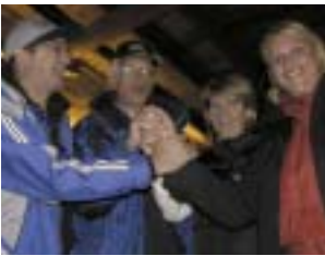
Vertreter der Gletscherregionen (Hintertux, Pitztal, Sölden, Stubaital)

Die Tirol Werbung eröffnete gemeinsam mit allen fünf Tiroler Gletschern den Winter in Polen. Mit 300.000 Winternächtigungen ist Polen unter den Top 10 der