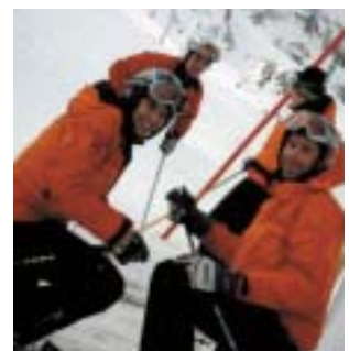
Kniefall ohne Skier

der Gletscherbrunch im Clubhaus mit Unplugged-Gitarren-Sound.