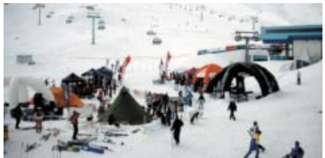
Testarea am Gamsgarten

Über 600 Telemarker aus über 15 verschiedenen Nationen waren beim zweitgrößten Telemarkfestival in Europa anwesend. Insgesamt wurden 450 Stück Testpässe ausgegeben. An den 2,5 Tagen wurden 180 Paar Skier verliehen. Beim spektakulären Telegross-Race sind insgesamt 45 Teilnehmer gestartet. Die jüngste Teilnehmerin kam aus Italien und war gerade 11 Jahre alt. Highlight war