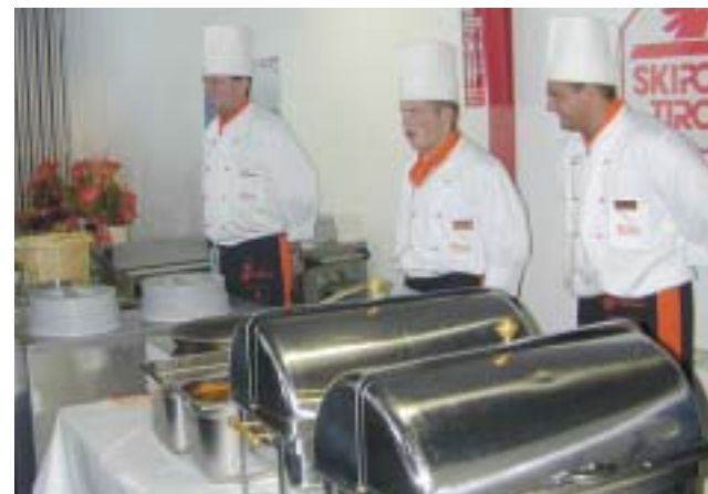
Mittagsbuffet in der Halle West