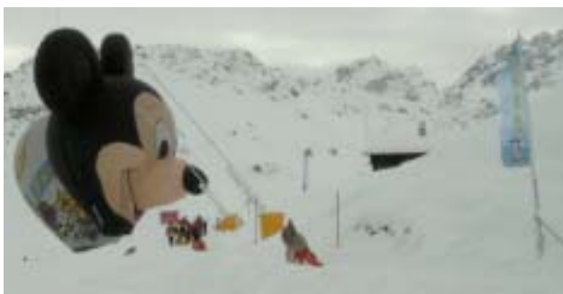
Alles im Zeichen der Micky Maus - Skigebiet Arosa

eingeladen. Trotz Schneemangel war die Veranstaltung ein voller Erfolg und es blieb sogar Zeit für ein Foto mit Micky Maus.