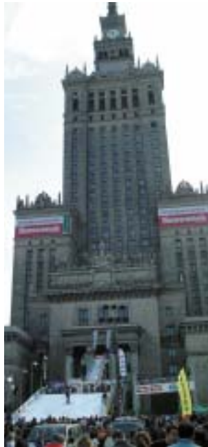
Kulturpalast mit Skipiste

Quellenmärkte für den Tiroler Tourismus. Im Handgepäck mit dabei: Rampe "Wildspitz" mit 14m Höhe und 50m Länge, 120 Tonnen Tiroler Gletscherschnee. Am Fuße des 220m hohen Wahrzeichens "Kulturpalast" wurde ein richtiges Tirol Dorf mit Holz-